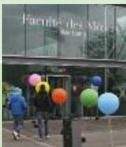
Pour fêter les 10 ans de la Faculté des Métiers : un air de fête accueillait les visiteurs sur le campus de Ker Lann (Bruz)

Quelques chiffres : 3 200 visiteurs sur le site de Bruz (campus de Ker Lann, tous instituts de formation confondus CMA et CCI), 500 visiteurs à Saint-Malo et à Fougères.