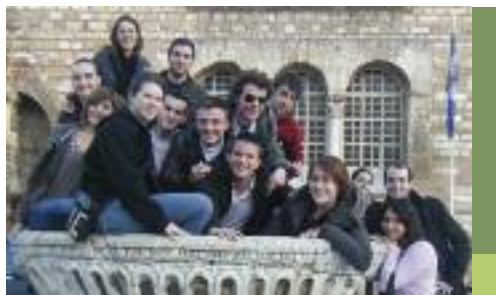
Les apprentis prothésistes dentaires devant l'église Saint Dimitri (St patron de la ville)

Quatorze jeunes prothésistes, en 1ère année de Brevet Technique des Métiers (BTM) de la Faculté des Métiers, site de Bruz, ont passé 3 semaines à Thessalonique, en Grèce.